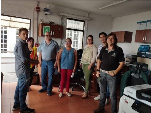
Edificio Anexo al Palacio Municipal